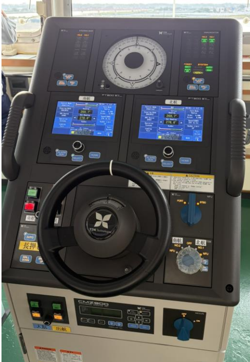
当社で開発した自動運航システムに対応するオートパイロット PT900

当社は、川崎汽船株式会社、川崎近海汽船株式会社、日本無線株式会社と連携し、自動運航システムの開発に取り組みました。その中で当社は、これまで長年蓄積してきた自動操舵に関わる知識と技術を応用したオートパイロットの開発に取り組み、自動避航操船および自動入出港を可能とするシステムの実現に寄与しました。その結果、当該システムを搭載した川崎近海汽船株式会社が運航する「第二ほくれん丸」は、自動運航船として国土交通省の船舶検査に合格しました。