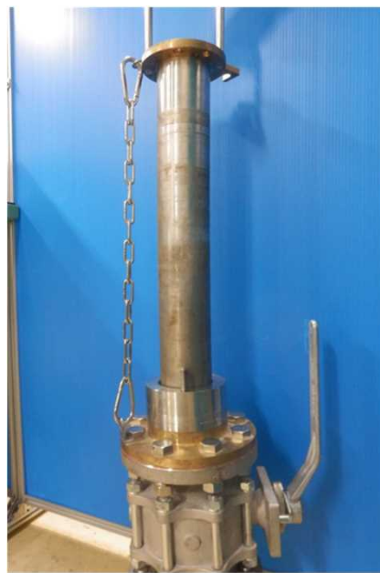
b.Sensorが引き上げられたチェーンが伸び切った状態