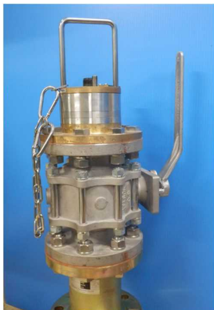
a.船底弁にSensorが入っている状態

このチェーンは正しくつながれた状態で、最大に伸びきると船底弁の開閉が可能な位置になります。